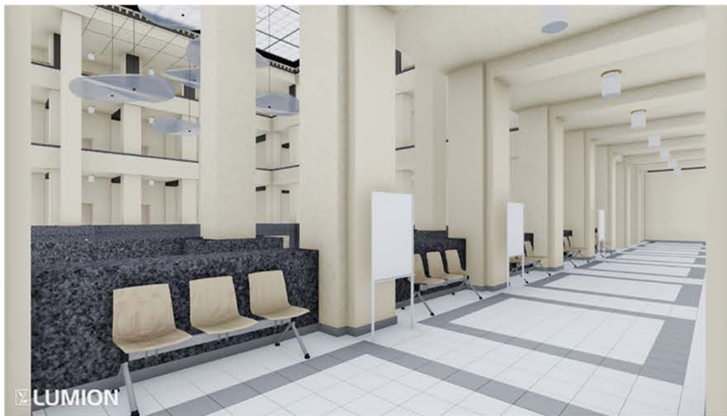
NAVRHOVANÝ STAV KAVÁRNA