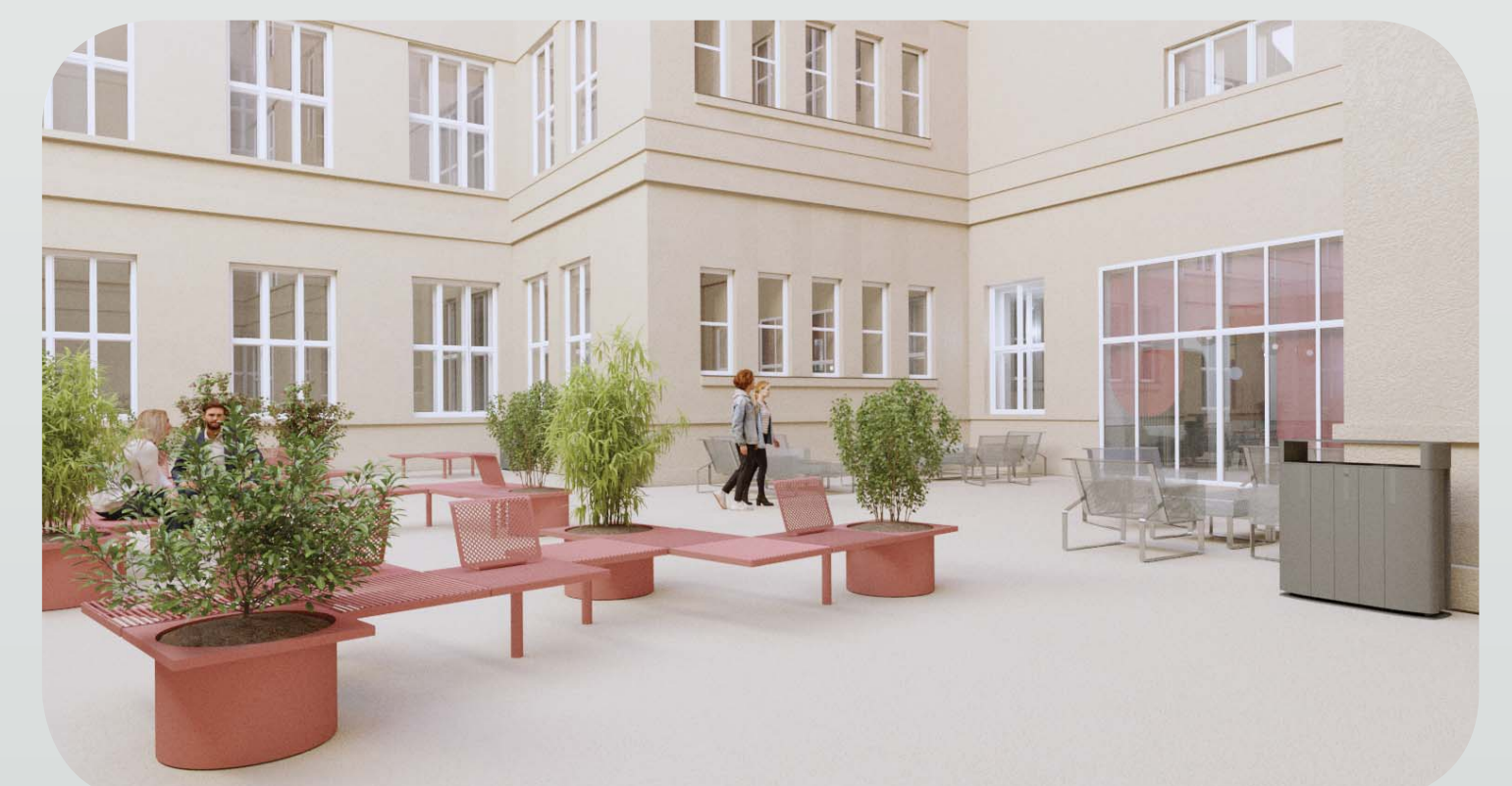
terasa vo dvore

Dvor budovy školy Právnickej fakulty má viacero výhod. Ide o priestor na čerstvom vzduchu, zástavba zo všetkých strán zabezpečuje odhlučnenie od diania v centre mesta a výhodou je aj estetický aspekt priečelia, ktorý vidno z dvora. Na danom mieste bola navrhnutá terasa. Navrhovaný priestor sa vyznačuje multifunkcionalitou, pričom hlavnou funkciou je zastrešenie parkoviska. Terasu možno využiť na čiastočné exteriérové sedenie pre kaviareň, sedenie v exteriéri pre študentov a učiteľov či na výstavy alebo konferencie na čerstvom vzduchu. Veľká plocha budovy, ktorá nemá okná môže slúžiť na premietanie v príjemných jarných a letných dňoch.