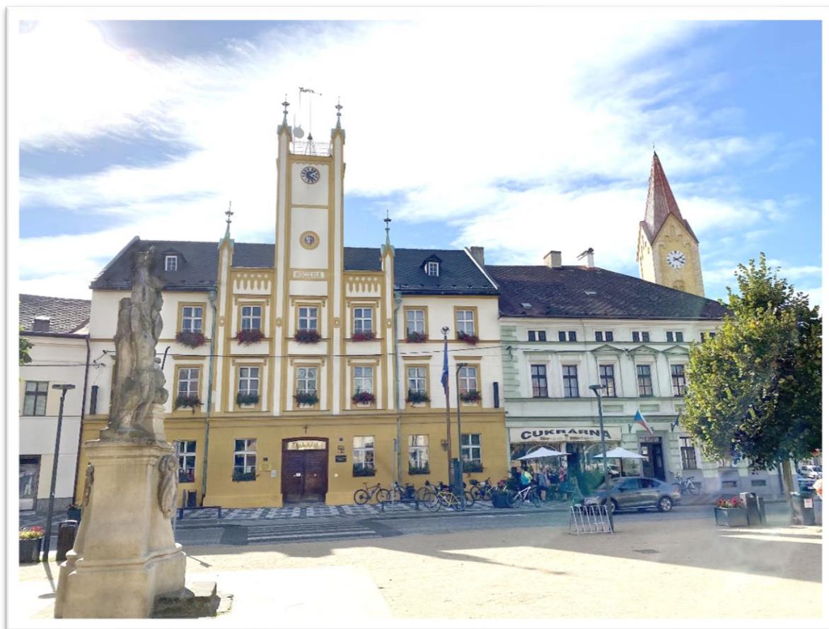
Novorenesanční radnice ve Mšeně. Vlevo sousoší Panny Marie a svatých Šebestiána a Rocha. V pozadí monumentální věž farního kostela svatého Martina z Tours, viditelná ze vzdálenosti 30 kilometrů.

Také vedení Společnosti pro církevní právo má dnes své vedlejší sídlo na území diecéze, a to v dávném královském městě Mšeno u Mělníka, ve vikariátu Mladá Boleslav. Samo město Mladá Boleslav je místem výroby automobilů značky Škoda a zajišťuje obyvatelům kraje hospodářskou prosperitu. A město Mšeno je bránou do významné turistické a chráněné přírodní oblasti kolem starodávných hradů Kokořín, Bezděz a Houska.